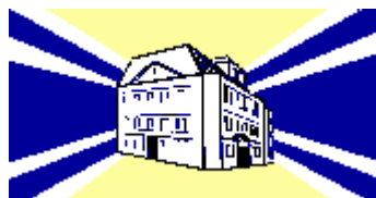
ZŠ T. G. Masaryka a MŠ Dolní Bousov