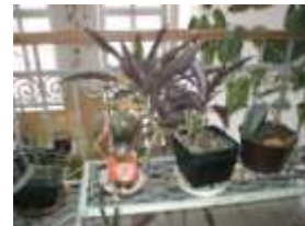
a náš vstup, to je něco